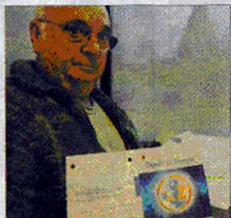
Louis Thomas estime que sa confiance était mal placée.